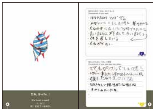
他のタネをトゲで守ってあげる優しいタネ(6年生男子)