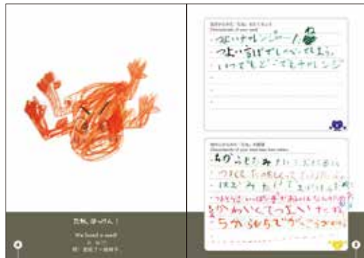
筋肉ムキムキのエネルギータネ(1年生女子)