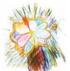
小学5年生(男子)の「花」