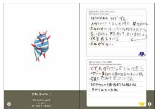
他のタネをトゲで守ってあげる優しいタネ(6年生男子)