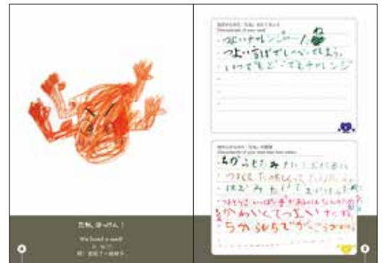
筋肉ムキムキのエネルギーなタネ(1年生女子)