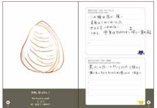
着実に誠実に生きていくしっかりものタネ(65歳男性)