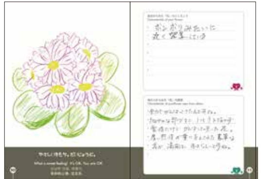
ゴージャスで、ふくよかな心が描かれた花(60台女性)