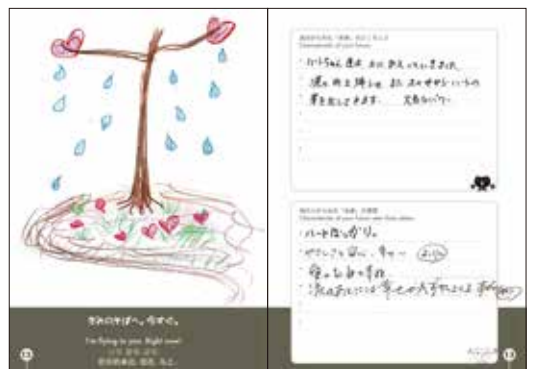
辛いこと悲しいことを優しさに変える未来のタネ(40代女性)